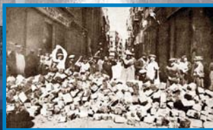
Barcelona "La Rosa de Foc"