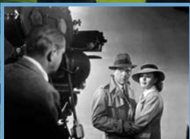
Els Orígens de Hollywood