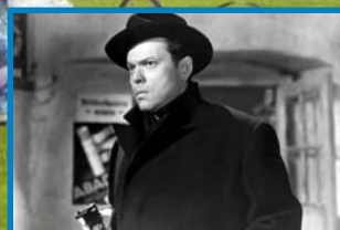
El Tercer Home