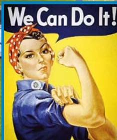
La Història en clau de Dona