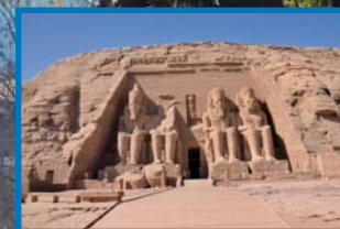
Temples Majestuosos de Ramsés

Flautista de Bec, Professor d'Història de la Música 250 Anys Naixement de Beethoven