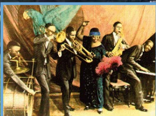
Petita Història del Jazz