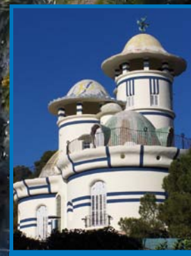
Sant Joan Despí: Ruta Jujol